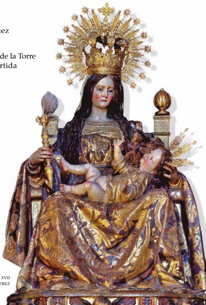
VIRGEN DE BELÉN. ANÓNIMO SIGLO XVII CATEDRAL DE ASIDONIA-JEREZ